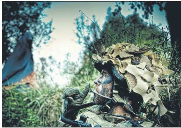
Krigsdokumentaren »Armadillo« går glip af mange millioner kr. i dvd-salg, fordi den først må sælges i butikkerne seks måneder efter biografpremieren.